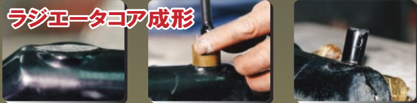
ラジエータコア成形