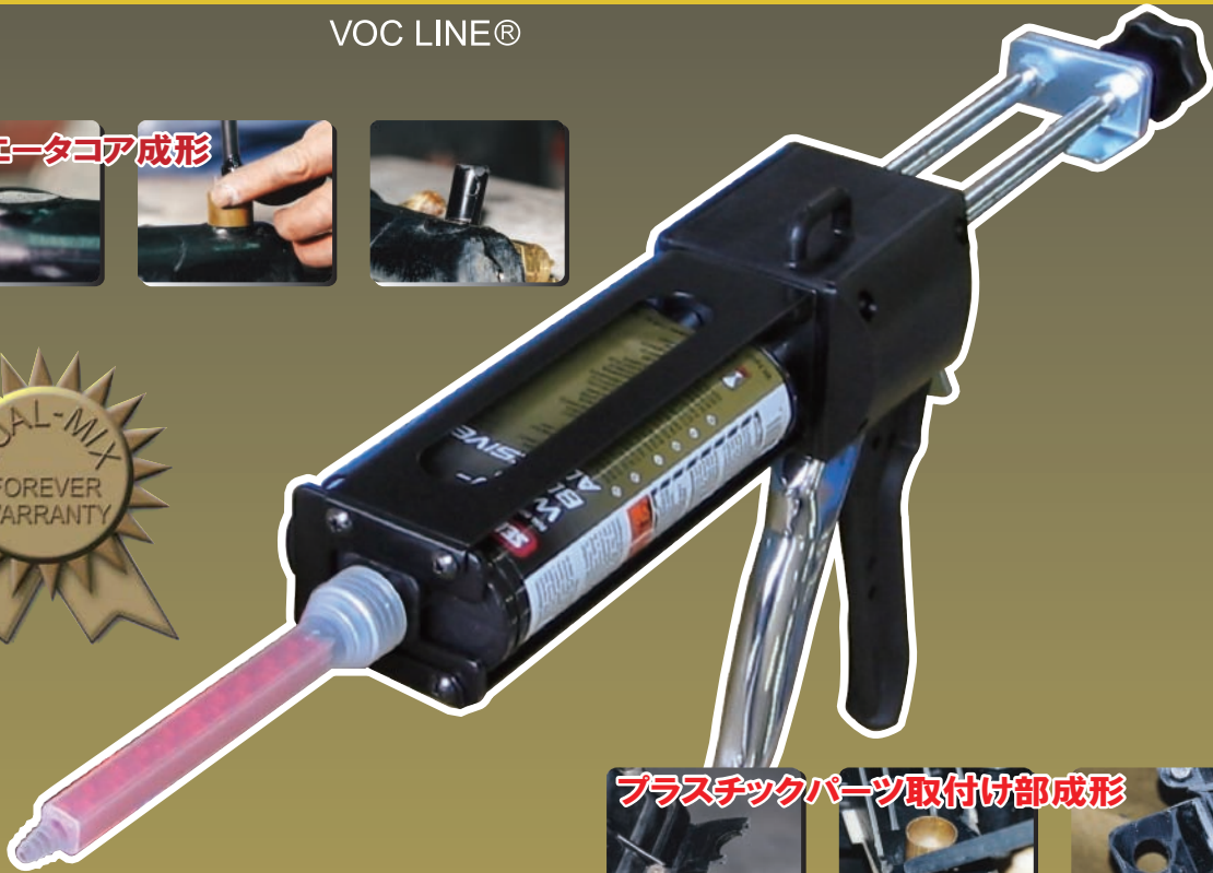
プラスチックパーツ取付け部成形